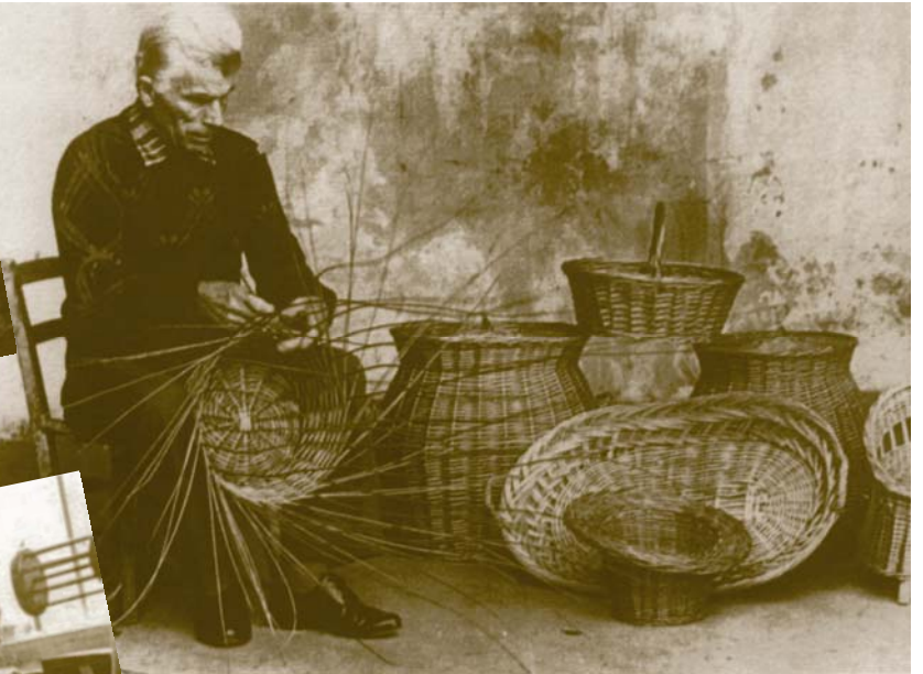
“Cestaro” (costruttore di ceste in vimini)