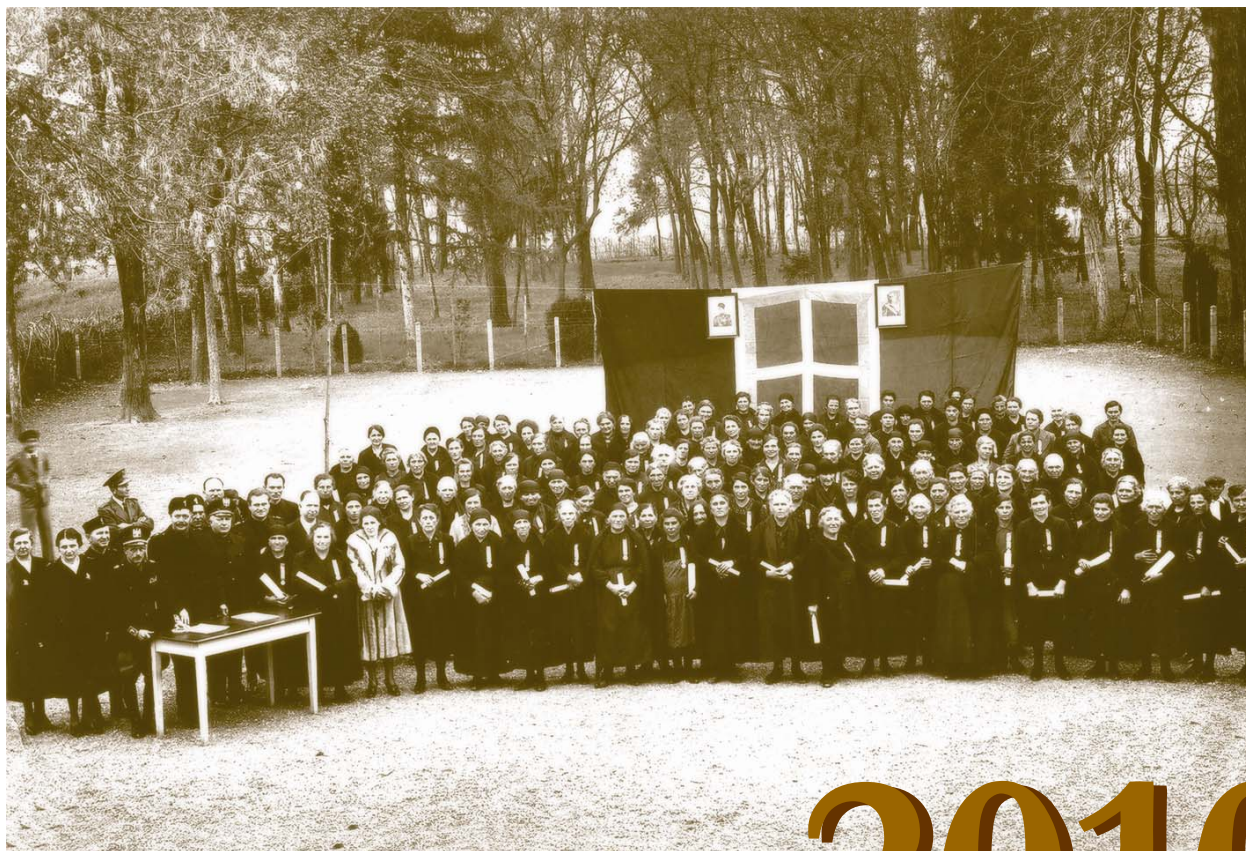
Le feconde mamme, nonne e bisnonne di ieri