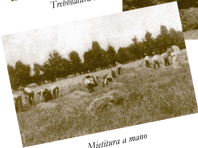
Mietitura a mano