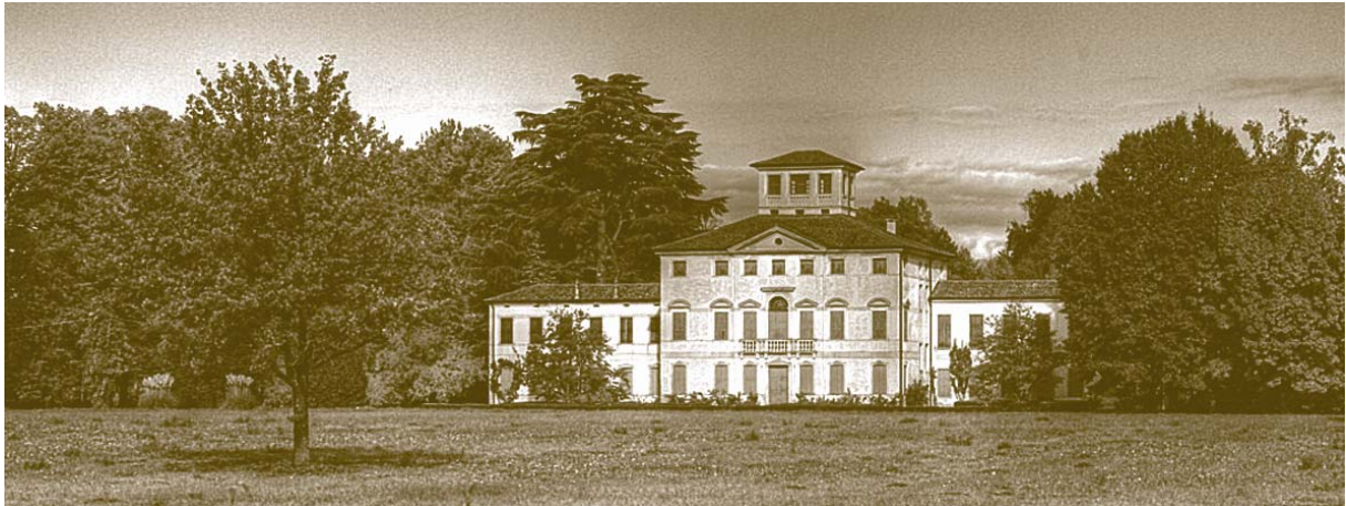
Villa Gallarati Scotti