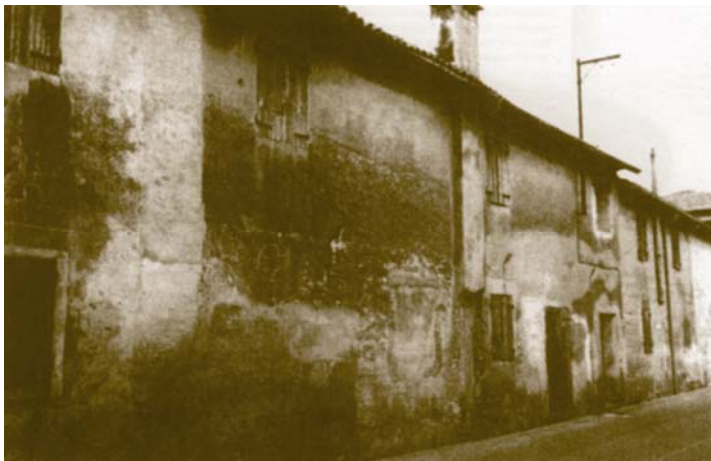
"Strada dee moneghe", ingresso vecchio asilo