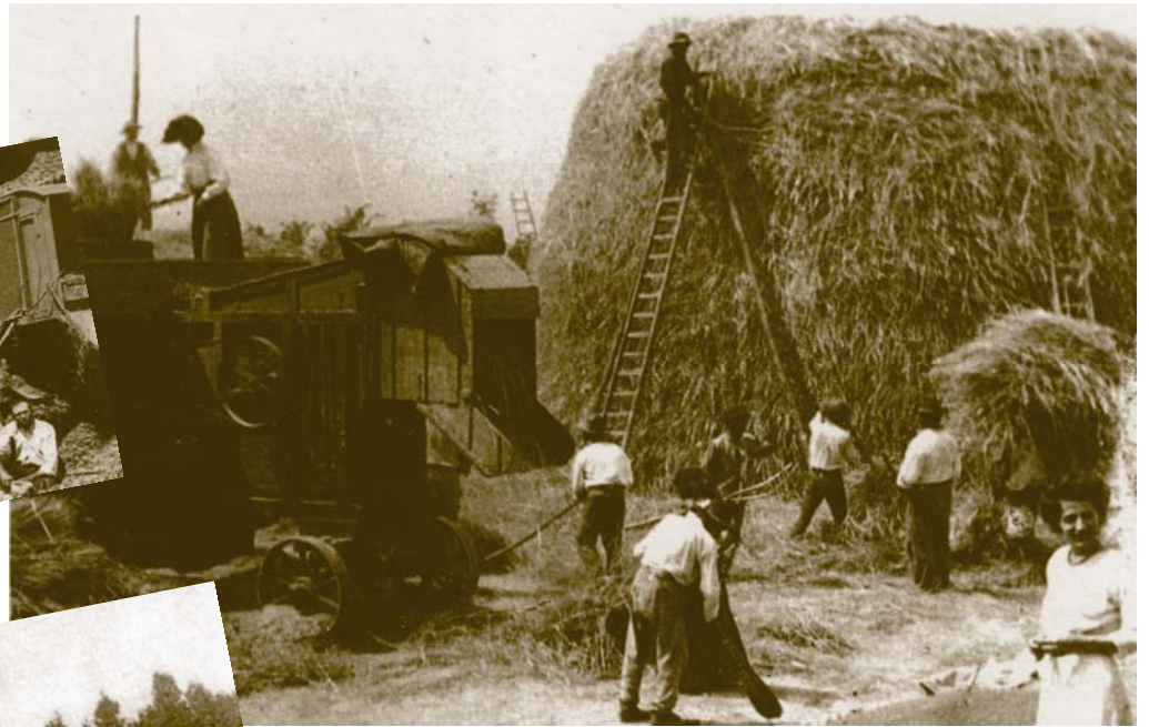
La costruzione del paiaro