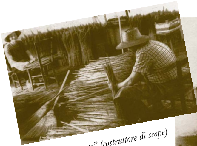
“Scoataro” (costruttore di scope)