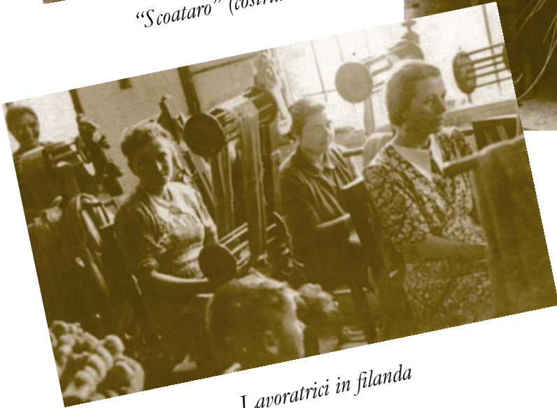
Lavoratrici in filanda